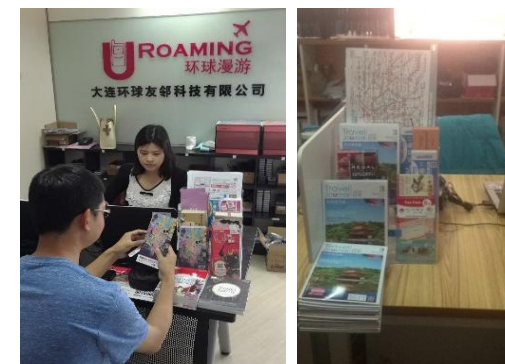
市内カウンターの様子