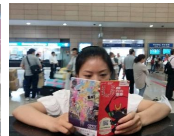
空港内カウンターの様子