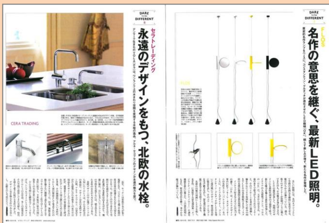
企画誌面イメージ