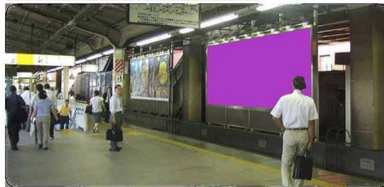
東京駅 内回り線ホーム（2面）