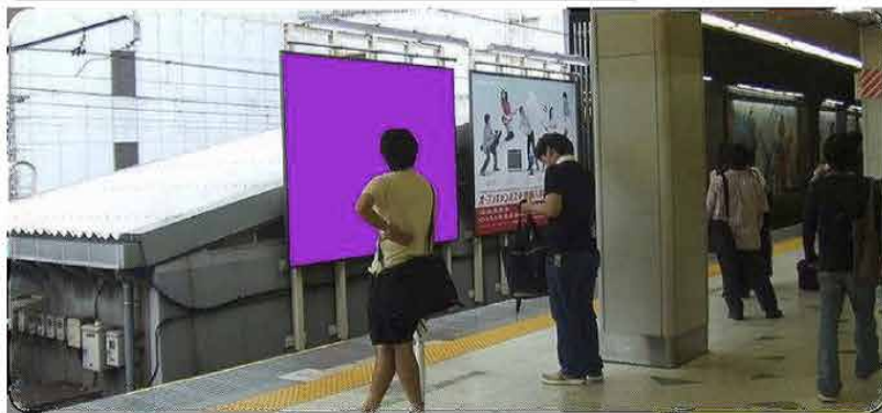
渋谷駅 外回り線（ハチ公口階段前）