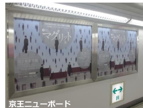
京王ニューボード