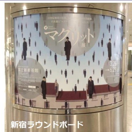
新宿ラウンドボード